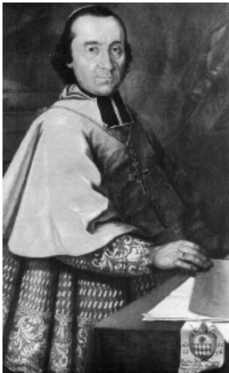
Bischof Joseph Anton Blatter.

Frankreich (Vergleichen E. Benezit: Dictionnaire des peintres, sculpteurs, dessinateurs et graveurs , zweite Ausgabe, Paris, 1948, Bd. I, S. 696). Ein Zweig aus Zermatt liess sich zu Beginn des 15. Jhs im Erinertal nieder, wo er heute noch blüht und das Bürgerrecht von Évölène besitzt.