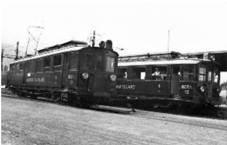
Automotrices du Martigny-Châtelard datant d'une époque antérieure à la direction de Guy Genoud, en 1968.

commerciale à Sion (1949). Employé (1950-1968), puis directeur (1968) des Chemins de fer Martigny-Châtelard et Martigny-Orsières.