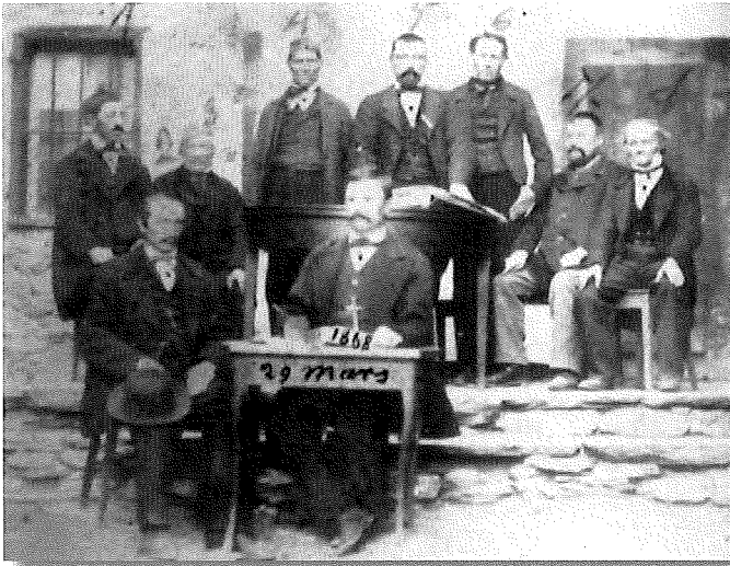
Le Conseil communal de Leytron le 29 mars 1868.

Leytron. La SPL enregistre et transpose sur fichier Excel les 7 BMS de la paroisse : registres des baptêmes, mariages et sépultures. En collaboration avec la commune, la SPL participe actuellement à l'installation d'une Maison du Patrimoine et à la mise en place d'un projet interrégional Leytron-Torgnon, commune du Val d'Aoste.