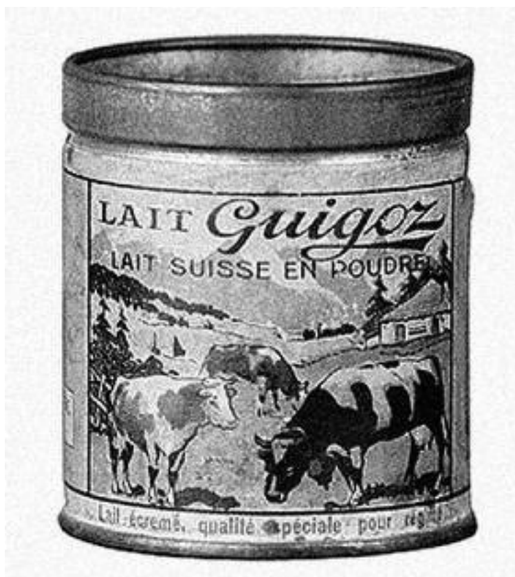
La fameuse boîte de lait Guigoz à ses débuts.