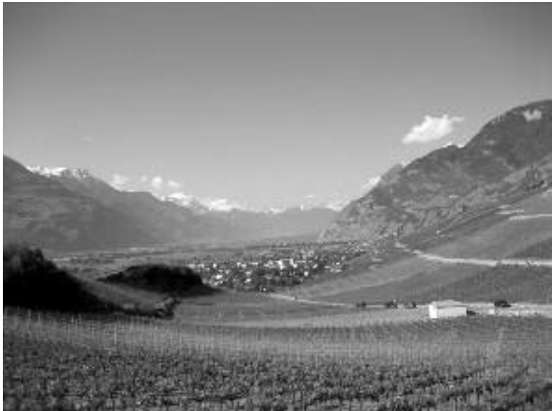
Vignoble et villages de la commune de Conthey.