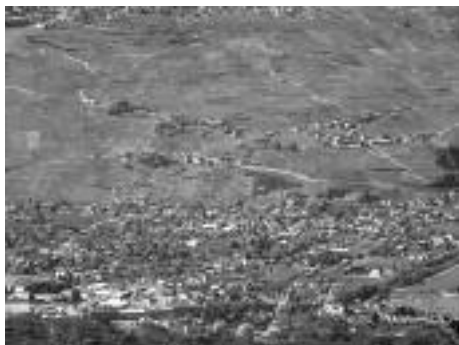
La grande commune de Conthey vue de Veysonnaz.

né en 1906, de Chamoson, député (1957-1961). Marcel, né en 1926, de Conthey, député (1969-1981). Pierre (1896-1977), prêtre (1922), docteur en philosophie, professeur au Collège de Sion (1922-1968), recteur du collège (1928-1962), chanoine honoraire de la cathédrale de Sion (1949).