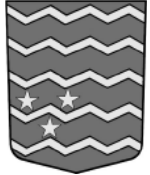
Armoiries de la famille Tabin: de gueules à 5 faces virées d'or et trois étoiles à 5 rais.

Un mot au sujet de l'origine du nom. Celui-ci a très certainement, par sa racine « Tab », une relation avec la montagne, un haut plateau, comme le mont Thabor, en Palestine, où eut lieu la Transfiguration du Christ, et le mont, le promontoire et la mer Tabin des géographes anciens, avec pour accentuer le suffixe « ing » qui semble indiquer une appartenance. Heureusement que personne n'est venu témoigner de l'établissement du patronyme, ce qui laisse à la formulation d'hypothèses une certaine marge d'imagination et de fantasmagorie 23 .