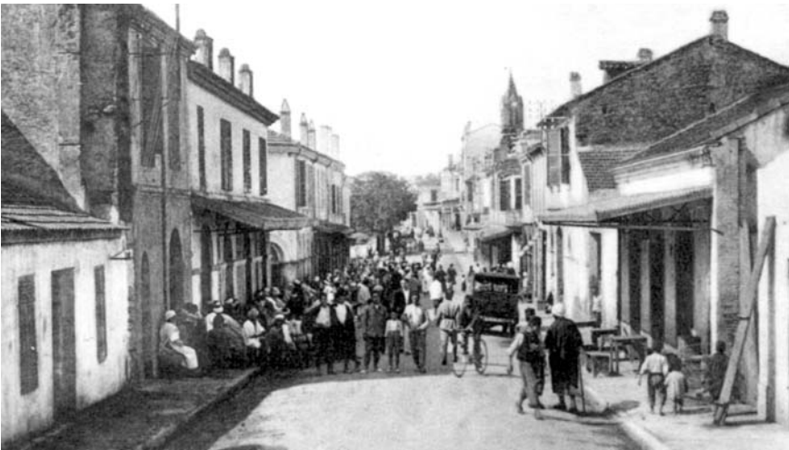
Koléah, la rue Carnot.

Dès février 1852, l'administration coloniale procéda au remplacement des familles parties. Mais cette fois, elle choisit des colons français, venant d'Alsace et de Franche-Comté ou se trouvant déjà en Algérie, mais surtout ayant des ressources pécuniaires suffisantes. Les villages du Sahel eux aussi accueillirent de