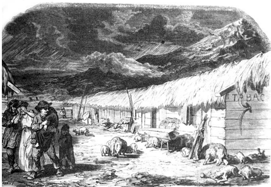
La colonie de Zurich, après l'épidémie.

(pénurie d'eau). A la mi-octobre, les fièvres apparurent avec leurs cortèges de malades et de morts et s'accroissaient même durant l'année 1852 où l'on dénombra plus de 60 décès. Si bien que ces villages se vidèrent eux aussi, d'autant plus que un certain nombre de colons se décidèrent également à rentrer en Valais. Ainsi, en octobre 1852, octobre les villages de Saïghr et de Zoudj el Abess ne comptaient respectivement plus que 14 et 17 familles valaisannes.