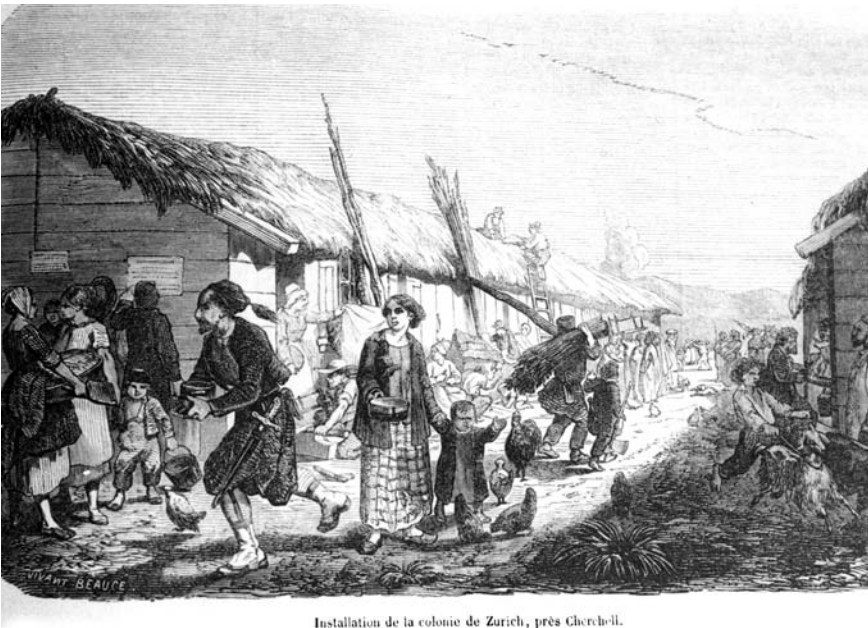
Installation de la colonie de Zurich, près Cherchell.

Dans les villages de Zoudj el Abess, Saïghr, Messaoud, Chaïba et Berbessa, les 236 habitants valaisans (42 familles) 6 connurent aussi des difficultés dès l'été